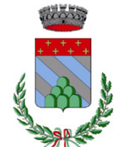
Comune di Valbrevenna