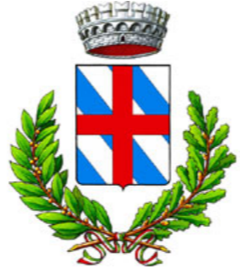
Comune di Montoggio