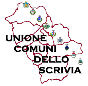
Unione Comuni dello Scriveria