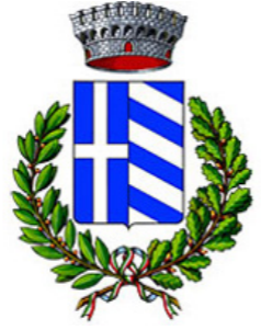
Comune di Crocefieschi